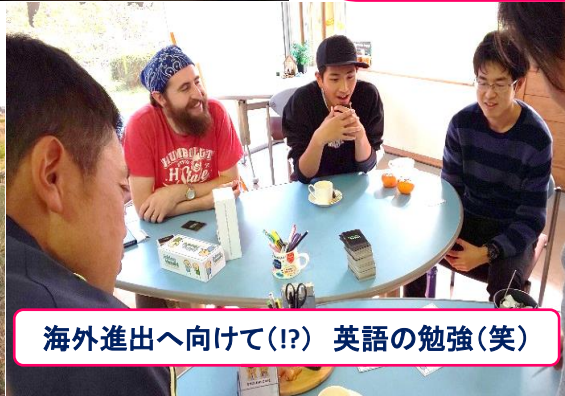
海外進出へ向けて(!?) 英語の勉強(笑)